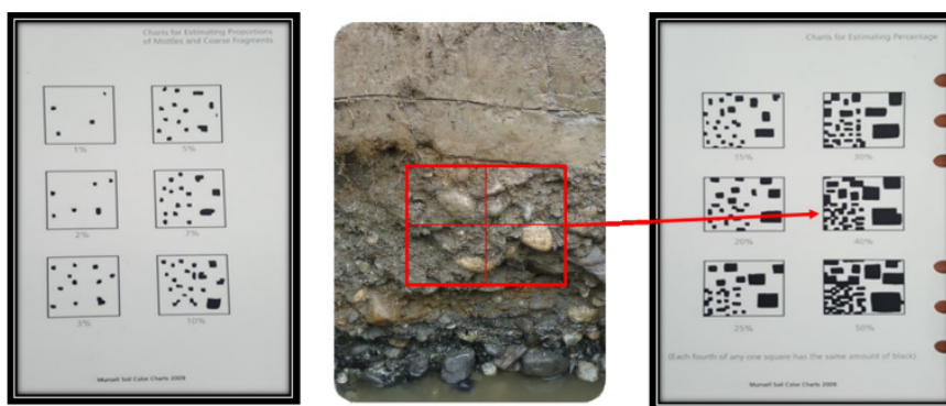
Figura 3. Tipos de fragmentos de roca en el suelo